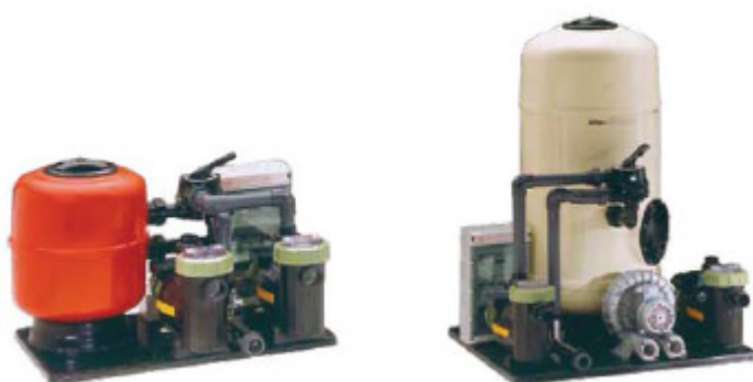
KIT COMPACT 50 Y 75: Preensamblados para filtración, calefacción y masaje.