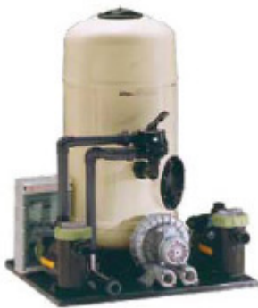
KIT COMPACT 75: Preensamblados para filtración, calefacción y masaje.